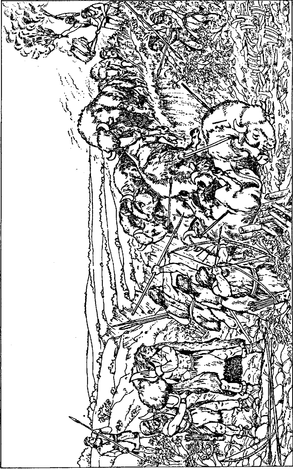
Рис. 1. Половання на бізонів у Надчорномор'ї у пізньому палеоліті. Реконструкція О. О. Кротової за матеріалами стоянки Амвросіївка. Худ. П. Л. Корнієнко