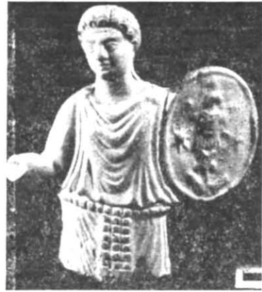
Рис. 1. Козирське поселення:

I — Козирське укріплене поселення (городище) I ст. до н. е. — середини III ст. н. е.; II — Козирка IX — бронза, архаїка і поховання (могилиник) Козирського укріплення I ст. — першої половини II ст. н. е. Умовні позначення: I — місце знахідки теракоти.