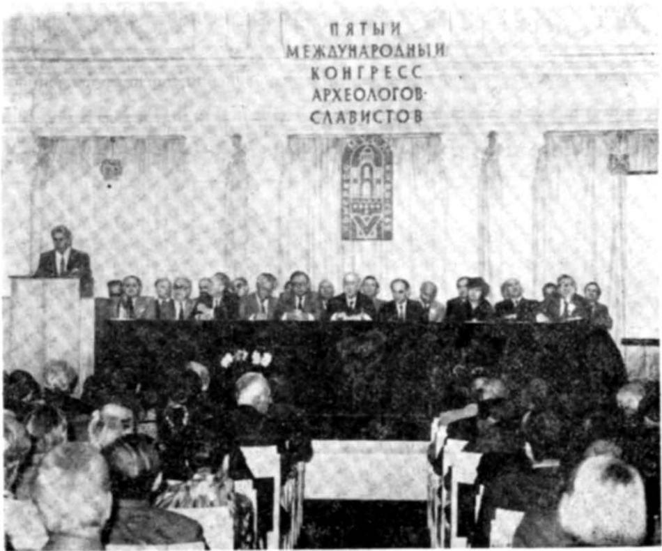
Рис. 1. Відкриття V Міжнародного конгресу археологів-славистів.

СРСР та тринадцяти країн Європи. Крім радянської делегації, до якої входили спеціалісти з Москви, Ленінграда, Києва, Мінська, прибалтійських республік, Молдавії та ін., великі делегації прибули з ПНР, НРБ, НДР, ЧССР. Крім того, вчені з Угорщини, Румунії, Югославії, а також Норвегії, Швеції, Бельгії, ФРН і Фінляндії. В засіданнях прийняло участь близько 250 гостей — представників науки та громадськості м. Києва.