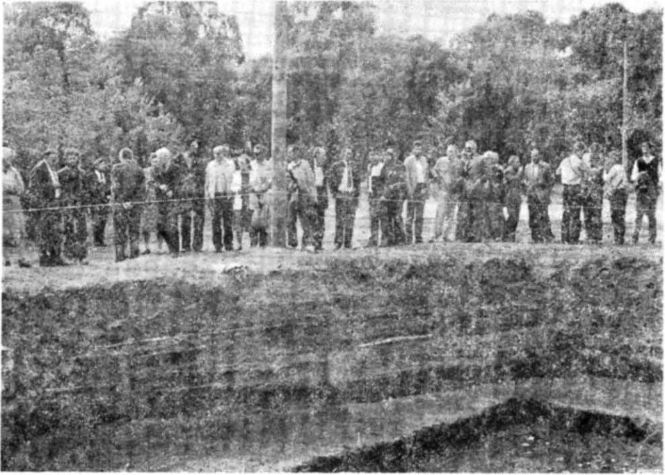
Рис. 2. Учасники конгресу на місці розкопок у Чернівці.

питань використовувались дані писемних джерел — А. Л. Ястребицька, Г. В. Глазирина, Т. М. Джаксон, Ю. В. Франчук (СРСР), нумізматика — А. В. Фомін (СРСР), Є. Кольникова (ЧССР) та інших допоміжних історичних дисциплін. В доповідях відзначено інтенсивний характер економічних і культурних взаємозв'язків між різними країнами і народами й активну участь в них слов'ян, які в епоху раннього середньовіччя досягли високого суспільного розвитку.