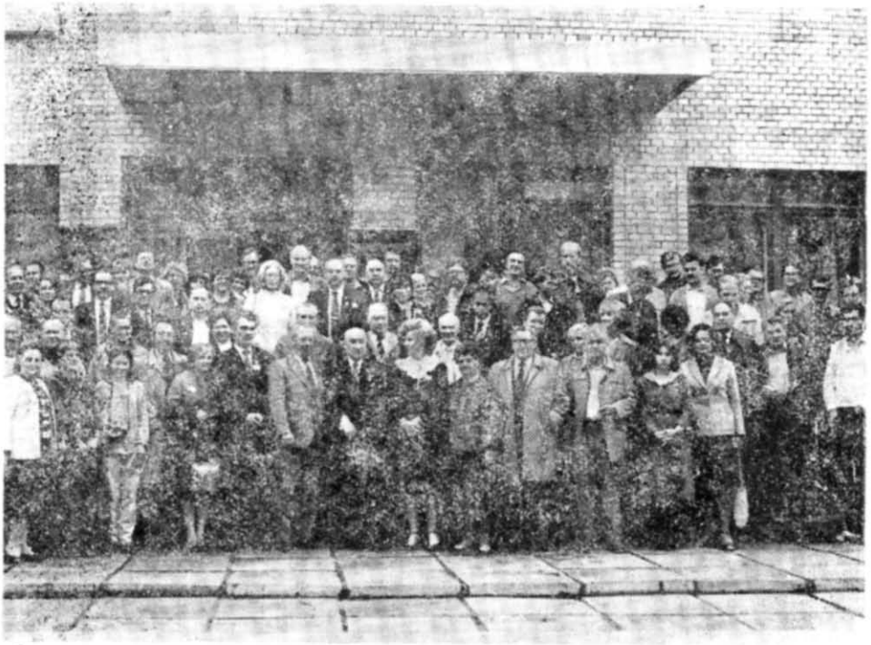
Рис. 3. Учасники конгресу у Переяславі-Хмельницькому.

су і гостей. Було висловлено ряд пропозицій щодо комплексного вивчення проблем етногенезу і ранньої історії слов'ян представниками таких дисциплін, як археологія, історія, лінгвістика, антропологія, етнографія та ін. Зазначено, що виникає потреба організації археологами різних країн спільних експедицій по вивченню слов'янських пам'яток, особливо міст, організації між конгресами робочих семінарів і симпозіумів з важливих дискусійних питань давньої історії слов'ян.