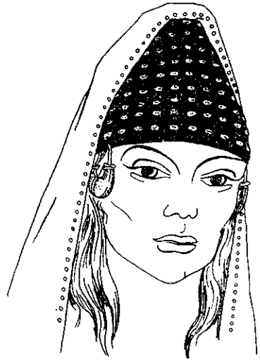
Рис. 7. Реконструкція убору з кургану № 4 поблизу с. Ізобільне Дніпропетровської області.

Конічна форма уборів, як зазначалося, була широко поширена в стародавньому світі. Наявна вона й у деяких народів нового часу. Етнографи вважають конусоподібні убори в народному костюмі ремінісценцією давніх форм. Наприклад, Б. А. Калоев вважає: «Характерна особливість осетинського головного убору — конусоподібна форма — свідчить про його спадковість від скіфів та аланів» 23 .