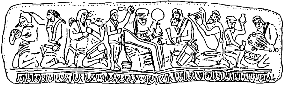
Рис. 5. Прорисовка сцен на сахнівській діадемі.

З цього приводу привертає увагу свідчення Платона, що скіфські чоловіки і жінки п'ють нерозбавлене вино, обливають ним одяг і визнають це «чудовим і блаженним заняттям» (Plato. Legg. I, 9). Сцени пиття вина скіфами поодинокі в тореветиці. Крім того, в них вкладено особливий символічний зміст. Так, на золотій сахнівській діадемі представлена композиція з десяти людських постатей, що утворюють більш-менш самостійні групи (рис. 5). У даному випадку звернемось до крайньої праворуч сцени — два безбородих юнаки наповнюють посуд вином з амфори. Один із скіфів стоїть навколішки, тримаючи в руках амфору з канельованим тулубом. Поруч з ним юнак, який припав на одне коліно, підставивши під струмінь ритон, який він тримає у правій руці. У лівій, піднятій догори руці, в нього посудина з округлим тулубом. Поміж скіфами стоїть лутерій з двома ритонами та келихом, які вже, певно, наповнені вином. Для цієї пам'ятки притаманні схематизм та деякий примітивізм. Деталі облич, костюмів не виділені. Постаті показані силуетно, загальними масами.