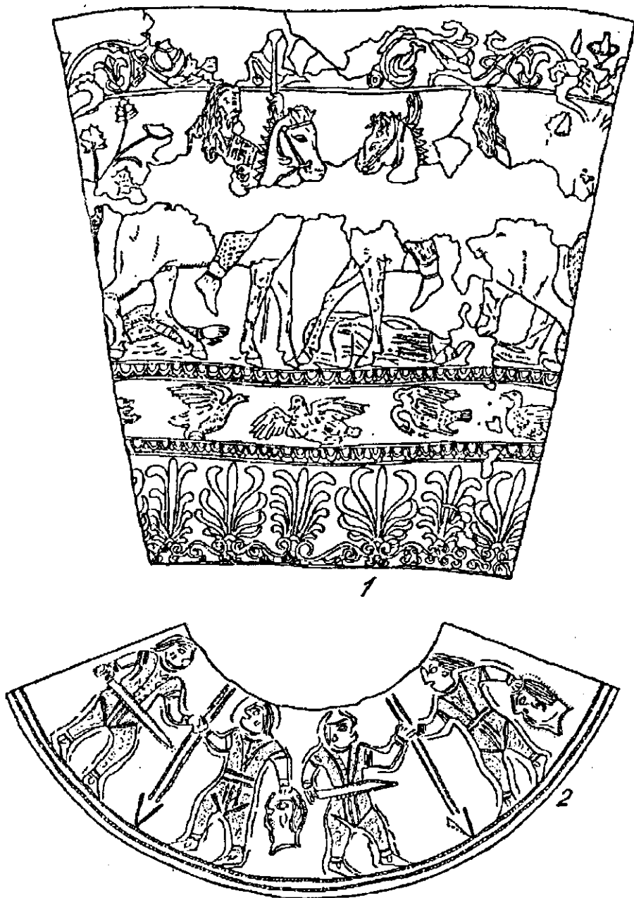
Рис. 4. 1 — сцена на ритоні з Карагодеуашху; 2 — ковпачок з Курджипсу.

сюжетах, а на пекторалі, зображено доярів корів та овець, найхарактерніша ознака скіфського побуту, так і не знайшла відображення в мистецтві.