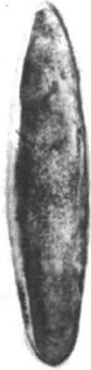
Рис. 5. Гривна з Готландського скарбу.