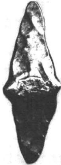
Рис. 6. Гривна з колекції Ермітажу.

поспіхом. Слід гадати, що особливо недовірливі контрагенти прямо на ринку бажали упевнитися в якості срібла, вдаряючи по гривні обухом бойової сокири чи руків'ям ножа. Саме так виглядають сліди вторинних ударів на багатьох гривнах (рис. 6).