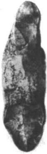
Рис. 4. Гривна з Готландського скарбу.