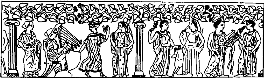
Рис. 3. Фриз на срібному кіліку з Солохи. Прорисовка.

До кола діонісійських сюжетів слід включити аттичний срібний канфар з гравірованими сценами із Солохи, який датується серединою — другою половиною V ст. до н. е. (рис. 3) 63 . Композиція складається з двох сюжетів, відокремлених один від одного за допомогою колон з іонійськими капітелями. На одному боці канфара — сцена танцю. На маленькому різьбленому стільці сидить дівчина, що грає на арфі. Поряд з нею танцюристка у легкому прозорому хітоні з кроталами в руці. По боках стоять дві слухачки, вдягнені в хітони та пеплоси. Композиція на другому боці також складається з чотирьох жіночих постатей, але вони нібито поділені на дві групи. Зправа — одна з дівчат тримає в руках кіфару та плектр, перед нею стоїть слухачка, що піднесла до носа гілочку рослини (плюща?). Зліва — дві співрозмовниці вдягнені у довгі пеплоси. Між ними стоїть лань, яка є одним з атрибутів Діоніса 64 . Верхню частину композиції займають чотири гілки плюща, розміщені над капітелями колон. Кінці гілок прикрашені гронами.