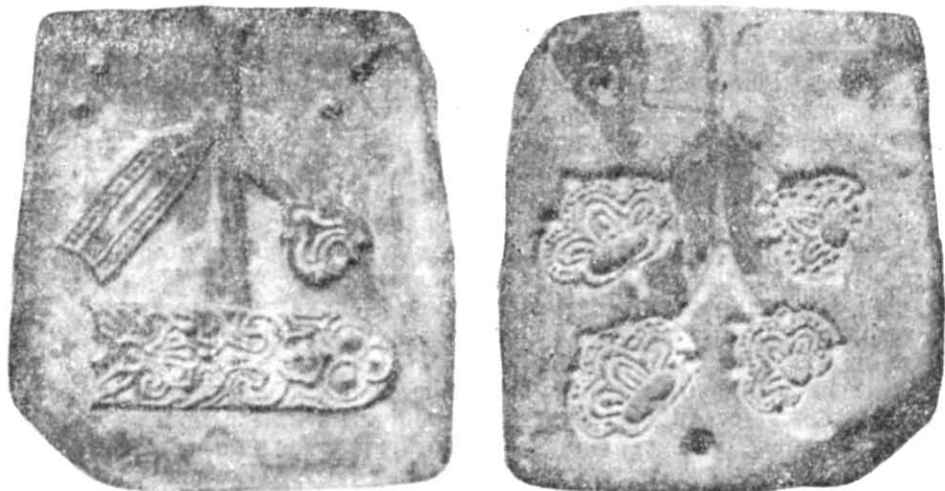
Рис. 1. Формочка № 1 для відливки поясного набору. Лицьова і зворотня сторони.

зово опубліковані формочки привертають увагу своєю унікальністю та цінністю закладеної в них інформації для історії київського мистецтва (рис. 1; 2). Автори публікацій вірно датували знахідку і підкреслили знакову функцію поясних наборів, металеві деталі яких відливались у пірофілітових формочках. Проте вони неточно вказали на типологічну