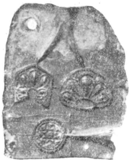
Рис. 2. Формочка № 2 для відливки збройного набору.

Наремінні бляшки, що відливалися у формочці № 2, найімовірніше являли собою деталі кінського спорядження — зброї. На це вказують їх більші розміри, а також факт використання аналогічних круглих бляшок з мотивом багатопроменевої зірки у відомому київському вуз-