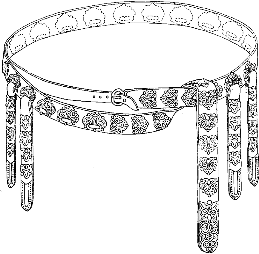
Рис. 4. Пояс с деталями, що відливались у формочці № 1. Реконструкція автора.

появу ливарних форм імітаційного типу, які, за останніми даними, з'явилися в середині XII ст. 37 В імітаційних формах відливалися вироби з свинцево-олов'яних сплавів, а більшість поясних наборів виготовлено зі срібла або мідних сплавів. Аналіз наремінної гарнітури чернігівських ювелірних майстерень свідчить про використання багатьох технологічних прийомів: ливарства, чеканки, золочення, інкрустації тощо.