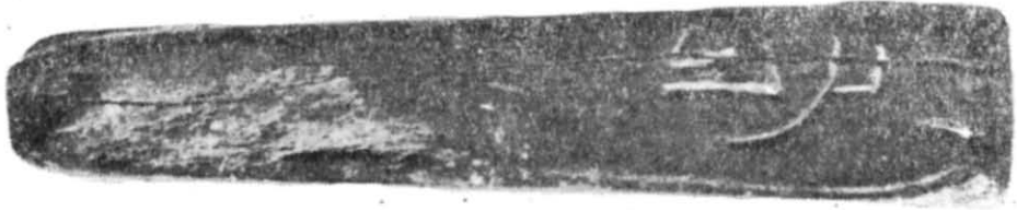
Рис. 3. Напис побажання «Благословення...» на ребрі формочки № 1.

До важливих висновків приводять спостереження над стилістичними та іконографічними особливостями київських ливарних форм. Крім згаданого мотиву багатопроменевої зірки на інших бляшках і наконечнику, відтворено мотиви три-, п'яти-, семипелюсткової квітки. Подібні