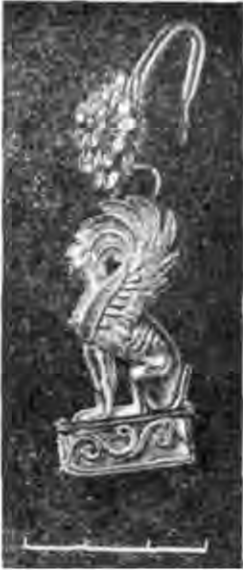
Рис. 8. Серезка золота. IV ст. до н. е. Розкопки кургану Огуз поблизу с. Нижні Серогози Херсонської області (Ю. В. Болтрик).

Серед найважливіших проблем розвитку науки на XXV з'їзді КПРС було висунуто такі, як проблема ефективності наукових досліджень, проблема посилення взаємозв'язку суспільних, природничих і технічних наук. Можливості широкої взаємодії археології з природни-