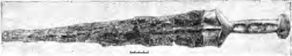
Рис. 6. Меч залізний з золотою обкладкою руків'я. Кінець V — початок IV ст. до н. е. Розкопки кургану поблизу м. Бердянська Запорізької області (М. М. Чередниченко).

У галузі давньоруської археології, вивчення історії і культури Київської Русі, розкопки давньоруських міст — Львова, Галича, Володимира-Волинського, Новгород-Сіверського, Путивля, Пересопиці, Юр'єва (м. Біла Церква) та інших дали нові матеріали для їх датування, вивчення соціально-економічної структури міст, торгівлі, ремесла, культури. Дослідження городищ і могильників давньоруського часу в Київській, Чернігівській, Черкаській, Ровенській, Волинській, Львівській та інших областях має велике значення для вивчення феодальних володінь і сільських поселень, рівня розвитку сільського господарства, побуту давньоруського населення. Вперше складено археологічну карту