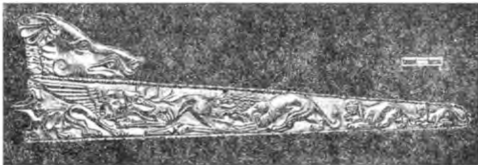
Рис. 4. Золота обкладинка піхов меча. IV ст. до н. е. Розкопки поблизу с. Велика Білозерка Запорізької області (В. В. Отрошенко).

неса» (перевидана в Англії), М. В. Скржинської «Северное Причерноморье в описании Плиния Старшего», Г. С. Русяевой «Земледельческие культы в Ольвии догетского времени», збірники «Исследования по античной археологии Северного Причерноморья» (відповідальний редактор В. О. Анохін), «Скульптура Херсонеса», «Граффити античного Херсонеса» (відповідальний редактор Е. І. Соломоник), «Исследования по античной археологии юго-запада Украинской ССР» (відповідальний редактор П. О. Каришковський).