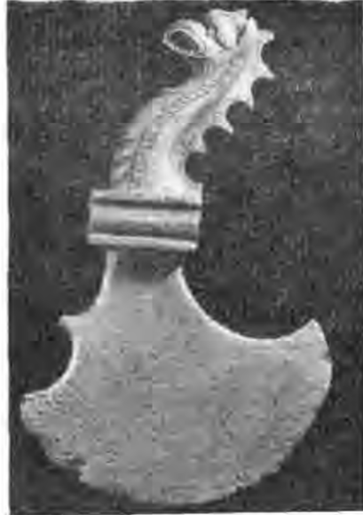
Рис. 9. Сокира бронзова. IV ст. до н. е. Розкопки поблизу с. Львово Херсонської області (А. І. Кубишев).

чими і технічними науками обумовлюються передусім самою природою археологічних джерел. Кожна археологічна знахідка — це опредмечений згусток людської праці, думок, творчості, відрізок історії народу, працею якого його створено. Завдання археолога полягає в тому, щоб від кожної археологічної пам'ятки отримати максимум історичної інформації.