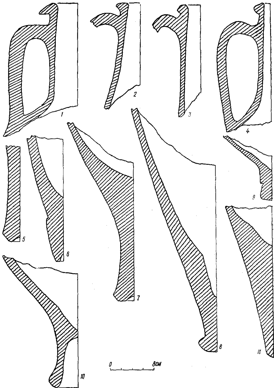
Рис. 2. Амфори IV ст. до н. е.— II ст. н. е. (1—11).

Значну частину керамічної тари IV ст. до н. е. в Ольвії становлять амфори Гераклеї Понтійської (рис. 2, 5, 7). Це явище знайшло відображення і в описуваному комплексі. Серед них є цілі посудини і фрагменти. Окремі екземпляри мають енгліфічні клейма (на жаль, не всі вони досить виразні). Так, на поверхні однієї шийки (з сегментоподібними у розрізі вінцями — типу Гераклея I) наявне енгліфічне дворядкове клеймо без рамки, можливо, ретроградне 3 . На іншому фрагменті —