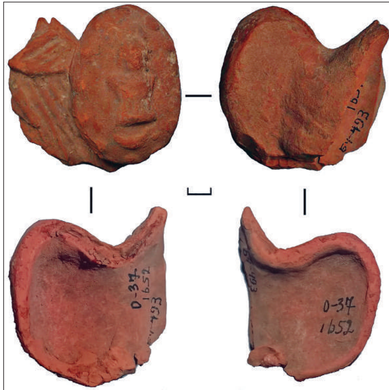
Рис. 3. Фрагмент теракоти римського воїна з розкопок ділянки НГ в Ольвії