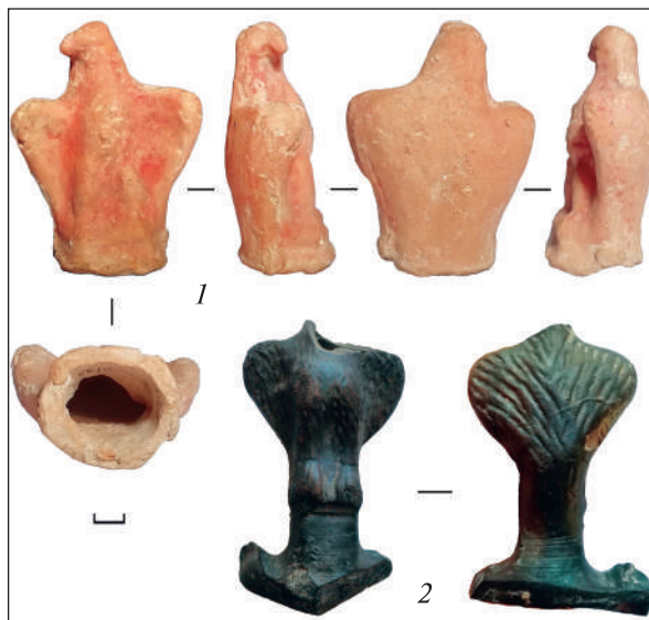
Рис. 1. Глиняні статуетки орлів з розкопок ділянки НГ в Ольвії

Наступна фігурка орла (глиняне навершя у вигляді пташки) 7 , розміром 10,2 × 3,8 см (рис. 2), знайдена у кв. 23, у жовто-глинистому шарі, на глибині 1,35—1,70 м, разом із червонолаковим світильником (Sheiko, Puklina 2019, р. 78, fig. 4: 2), скляним і керамічним посудом, зокрема ручкою червонолакової посудини у вигляді голови барана (пате-ра?); мідними римськими монетами та кістяною ложечкою, виявленими на цій глибині в суміжному квадраті.