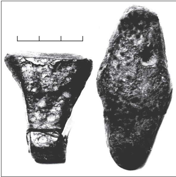
Рис. 2. Злитки (київські гривні) (половинка та ціла) з мідного сплаву зі значним умістом срібла — 4,14 %, 9,80 %, із фондів НМІУ