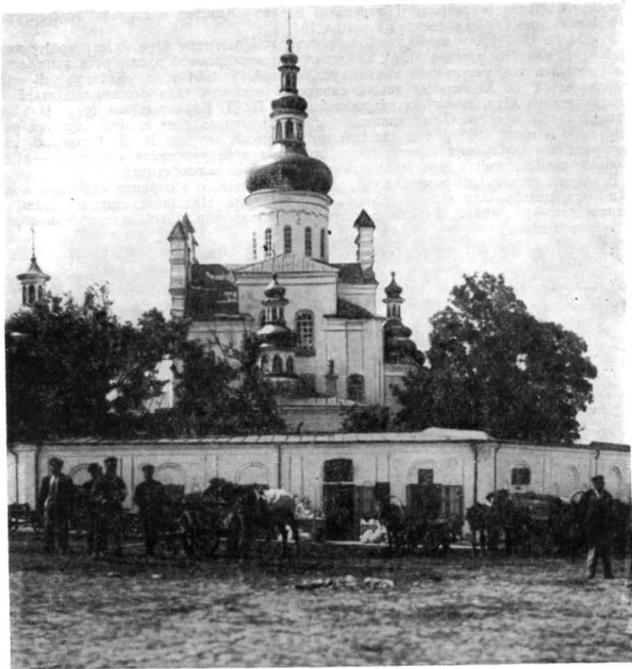
Рис. 1. Вид на П'ятницьку церкву після перебудов XVII—XIX ст.