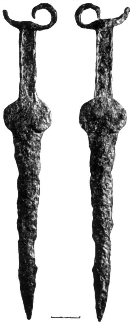
Акінак із с. Забір'я.

Подібні акінаки датуються кінцем VI — початком V ст. до н. е. 3 Випадковість знахідки не дає змоги точніше її датувати, але вона може стати в пригоді під час дальших досліджень скіфської доби в цьому районі.