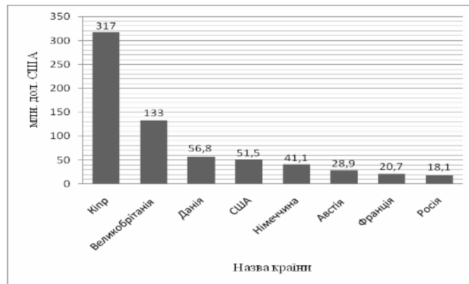
Рис. 1. Іноземні інвестиції в сільське господарство, млн. дол. США

Іноземні інвестиції в АПК України надходять у таких формах: