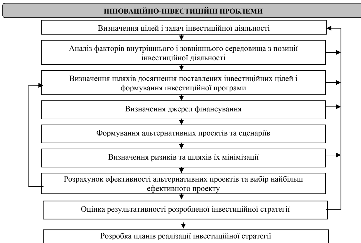
Рис. 2. Процес формування інвестиційної стратегії

Таким чином, нами був обґрунтований склад процесу формування інвестиційної стратегії та з'ясовано його зміст.