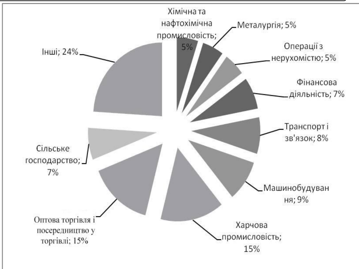
Рис. 2. Структура інвестування венчурного капіталу у галузі економіки України

Як видно з рис. 2, частка сільського господарства у інвестуванні венчурного капіталу є невеликою. Це пояснюється нестабільним положенням підприємств у даній галузі [4].