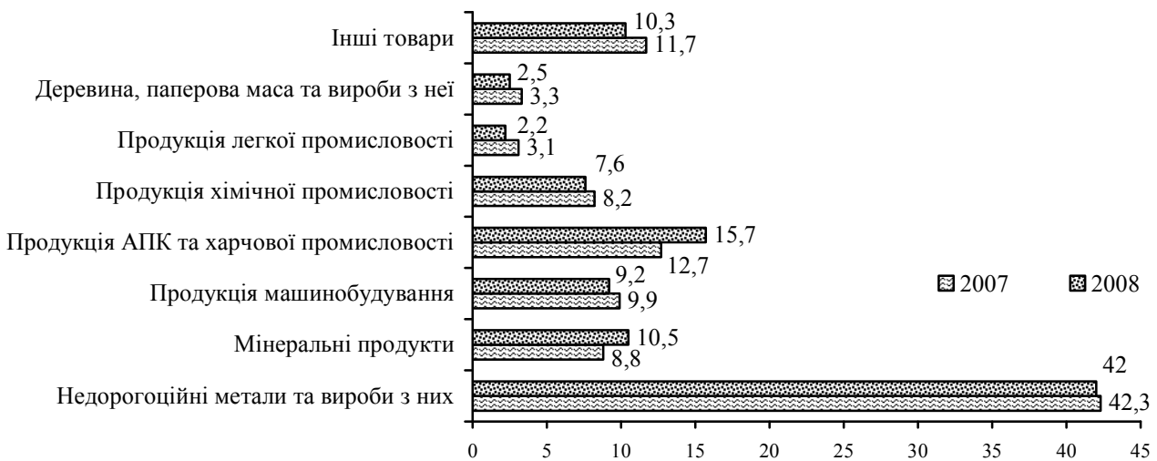
Рис. 2. Товарна структура експорту товарів, %

є здійснення програми заходів щодо підтримки експорту вітчизняних товарів. Згідно з концепціями вільної торгівлі конкурентоспроможними на світовому ринку є товари або галузі, які характеризуються порівняльними перевагами. Харчова промисловість України, виходячи із забезпечення раціонального використання її природного, виробничого, науково-технічного, інтелектуального потенціалу, апіорі визнається конкурентоспроможною галуззю, яка складає суттєву частину в експорті товарів (рис. 2) [1, с. 264].