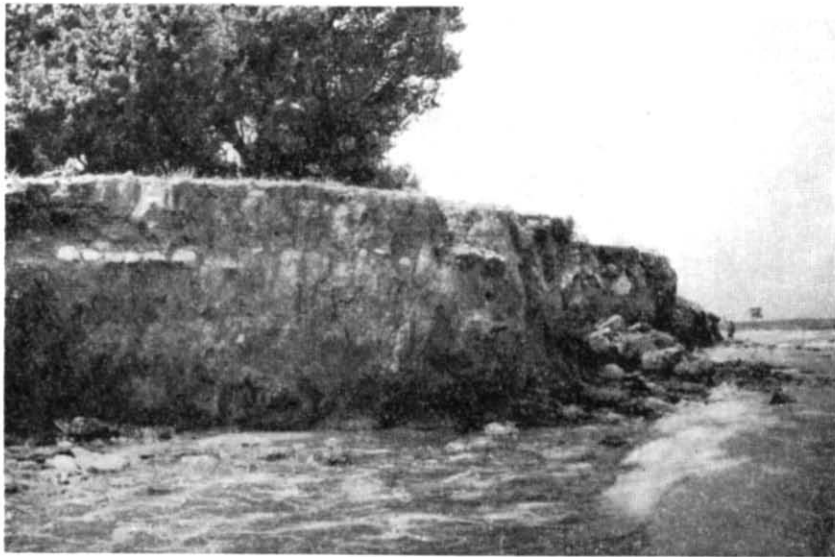
Рис. 2. Городище Маслини в ур. Чеголтай поблизу с. Северного.