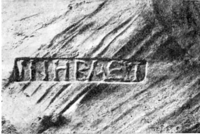
Рис. 2. Клеймо на поверхні цегли.

Подібна клеймована цегла значною кількістю траплялася в стінах візантійських будівель Константинополя та його околиць 3 і дуже рідко в інших містах Візантії 4 , але точних аналогій херсонеські клейма серед