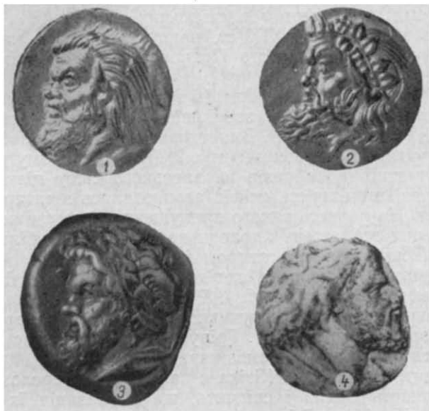
Рис. 2. Зображення сатира на монетах з Пантікапея.

Порівнюючи між собою всі відомі нам зображення скіфів, як на виробах торевтики і монетах, так і на інших пам'ятках, знайдених в Північному Причорномор'ї 21 , виділимо ряд спільних ознак поза вбран-