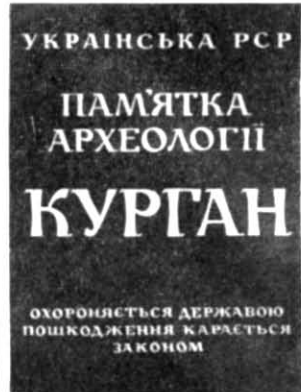
Рис. 3. Дошка-знак для встановлення на поодиноких курганах.

очевидним, що найвидатніші археологічні пам'ятки України, до яких належать, перш за все, археологічні заповідники, повинні мати знаки-пам'ятки, виготовлені за індивідуальними проектами, а всі інші об'єкти — типові дошки єдиного в межах республіки зразка.