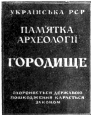
Рис. 1. Дошка-знак для встановлення на городищах

Завдяки проведеній роботі визначені певні критерії щодо форми і розмірів знаків, їх типу залежно від категорії пам'яток, змісту написів на дошках тощо. Так, стало