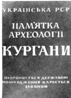
Рис. 2. Дошка-знак для встановлення у курганній групі.