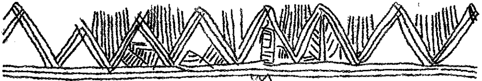
Рис. 2. Орнамент на горщику із музею м. Жданова (розворот).

Крім посуду, приналежність якого до катакомбної культури не викликає сумніву, в райгородській колекції є один з досить широкою шийкою горщик, зовсім позбавлений орнаменту (рис. 1, 9). Його поверхню старанно заглажена і підлощена. Цей горщик з двома досить чітко