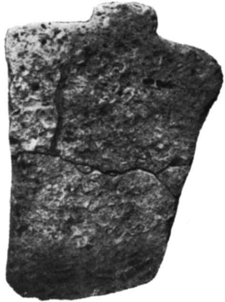
Рис. 2. Антропоморфна стела з кургану поблизу Мелітополя.

Давно вже помічена схожість між причорноморськими і західноєвропейськими антропоморфними стелами 3 . Таку ж схожість виявляють щодо східноєвропейських пам'яток антропоморфні стели Південної і Центральної Європи 4 . Близькість простежується не тільки в загальному оформленні стел, але й в трактовці деталей 5 . Інколи схожість