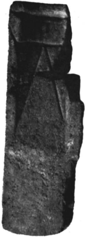
Рис. 2. Ливарна формочка, на якій зображений негатив кельта.

Велике значення має знайдена тут чотирихвітна ливарна формочка для лиття чотирьох предметів: кельта та трьох долот. Формочка виготовлена із одного бруска сланцевого талька, прямокутної форми довжиною 14,5 см, шириною 4,5—5 см, товщиною 3—4 см. Кути бруска в декількох місцях збиті (рис. 2). Нижче подаємо короткий опис предметів, відбитих на формочці 5 .