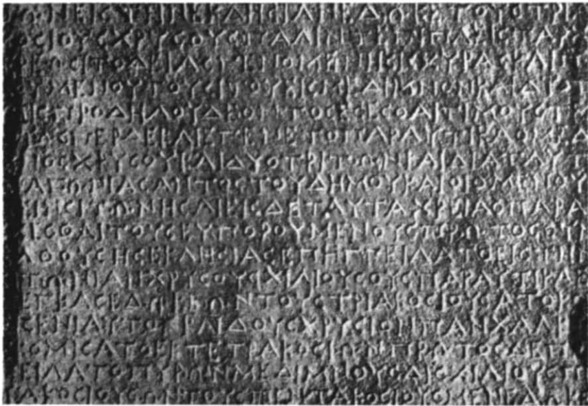
Рис. 1. Декрет на честь Протогена (деталь: бік А, рядки 57—73).

ту на честь Протогена за допомогою просопографічних даних приводить до того ж висновку, що й датування на підставі загальноісторичної обстановки: перша половина і середина III ст. до н. е. категорично виключаються, і треба уточнити час напису у межах останніх десятиріч III і перших десятиріч II ст. до н. е. Для цього слід зверну-