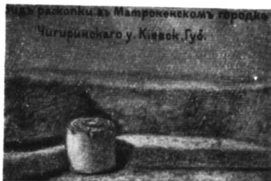
Рис. 4. Жертвник з Матронінського городища (малюнок В. В. Хвойки).

В архіві ЛВІА зберігається справа ІАК про розкопки В. В. Хвойки в Київській губернії. Там наведено такий опис Матронінського жертвника: «Споруда у вигляді глиняного стовпа висотою 70 см і 90 см в діаметрі. Верхня його частина являла собою круглу площадку з заглибленням в центрі, навколо якого... було розміщено 5 концентрич-