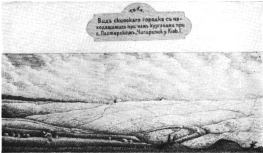
Рис. 2. Загальний вигляд городища (малюнок В. В. Хвойки).

«d», «e» позначені місця, де, за повідомленням Хвойки, були знайдені площадки обпаленої глини, які він вважав за місця поховань з трупоспаленням 6 . В пунктах «п», «і», «к», «е» були знайдені великі скупчення печини з відбитками плетених дерев'яних конструкцій, що являли собою залишки наземних споруд середини I тисячоліття н. е.— тут були знайдені серпи і наральники 7 .