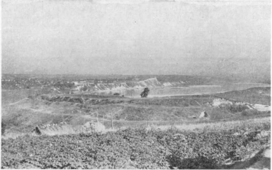
Рис. 1. Вид на городище Іван-Гора.

У внутрішньому ряді зрубів заповнені всередині ґрунтом невеликі кліті чергувались з більшими порожніми клітями, що були житлами, вмонтованими в загальний ряд городень по фронту. Перші з них мали розмір 2,6 \times 2,6 м, другі — 3,6 \times 2,6 м. На ділянці по краю городища були розкопані дві городні зовнішнього ряду, одне житло і дві городні внутрішнього ряду. Очевидно, верхній рівень городень, заповнених землею, відповідав рівню глиняного накату над колодами стелі житла. Під час пожежі цей накат разом з дерев'яним переkritтям завалився