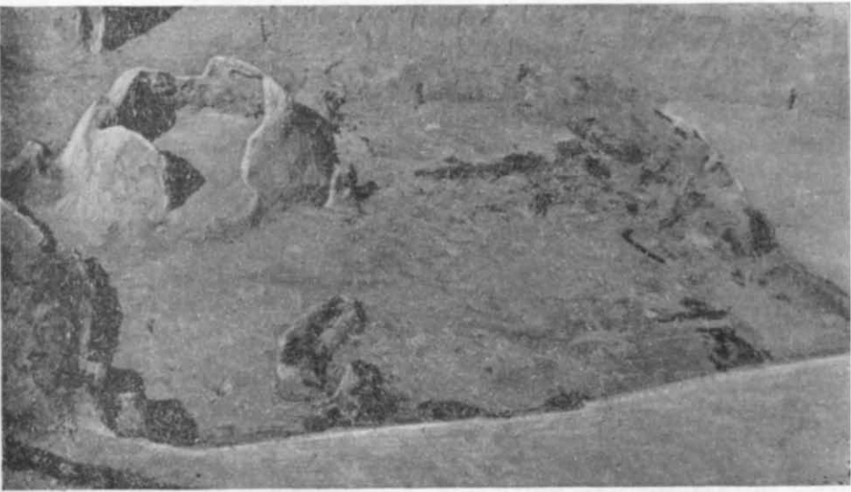
Рис. 3. Житло в західній частині городища.