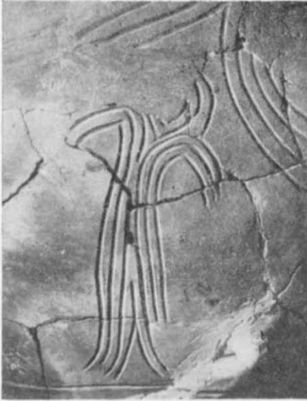
Рис. 3. Перше антропоморфне зображення.

Живописні і графічні антропоморфні зображення — рідкісне явище в сфері культури Кукутені — Трипілля 3 . Серед пам'яток трипільської культури Середнього Подніпров'я, крім гребенівських, відомі три