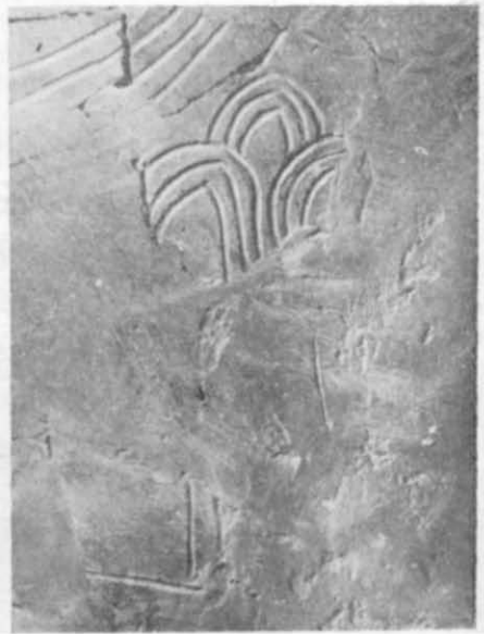
Рис. 4. Друге антропоморфне зображення.

антропоморфні зображення. Два з них знайдені за 8 км від м. Ржищева на трипільському поселенні, розкопаному В. В. Хвойкою між селами Щучінка і Балики в землянці № 8 4 . Зображення виявлені на фрагментах посуду з монохромним розписом. Перше зображення (табл. I, 2) збереглося повністю і передає фігуру оголеної жінки. Голова позначена чорним колом. Верхня частина тулуба модельована у вигляді трикутника, руки опущені донизу. Нижня частина тіла передана досить реалістично. Ліва нога трохи зігнута немов у русі.