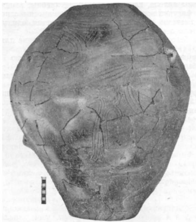
Рис. 1. Посудина з антропоморфними зображеннями.

У 1961 р. під час розкопок трипільського поселення біля с. Гребені, Кагарлицького району, Київської області 1 , на площадці № 4 було знайдено зерновик з двома антропоморфними зображеннями (рис. 1).