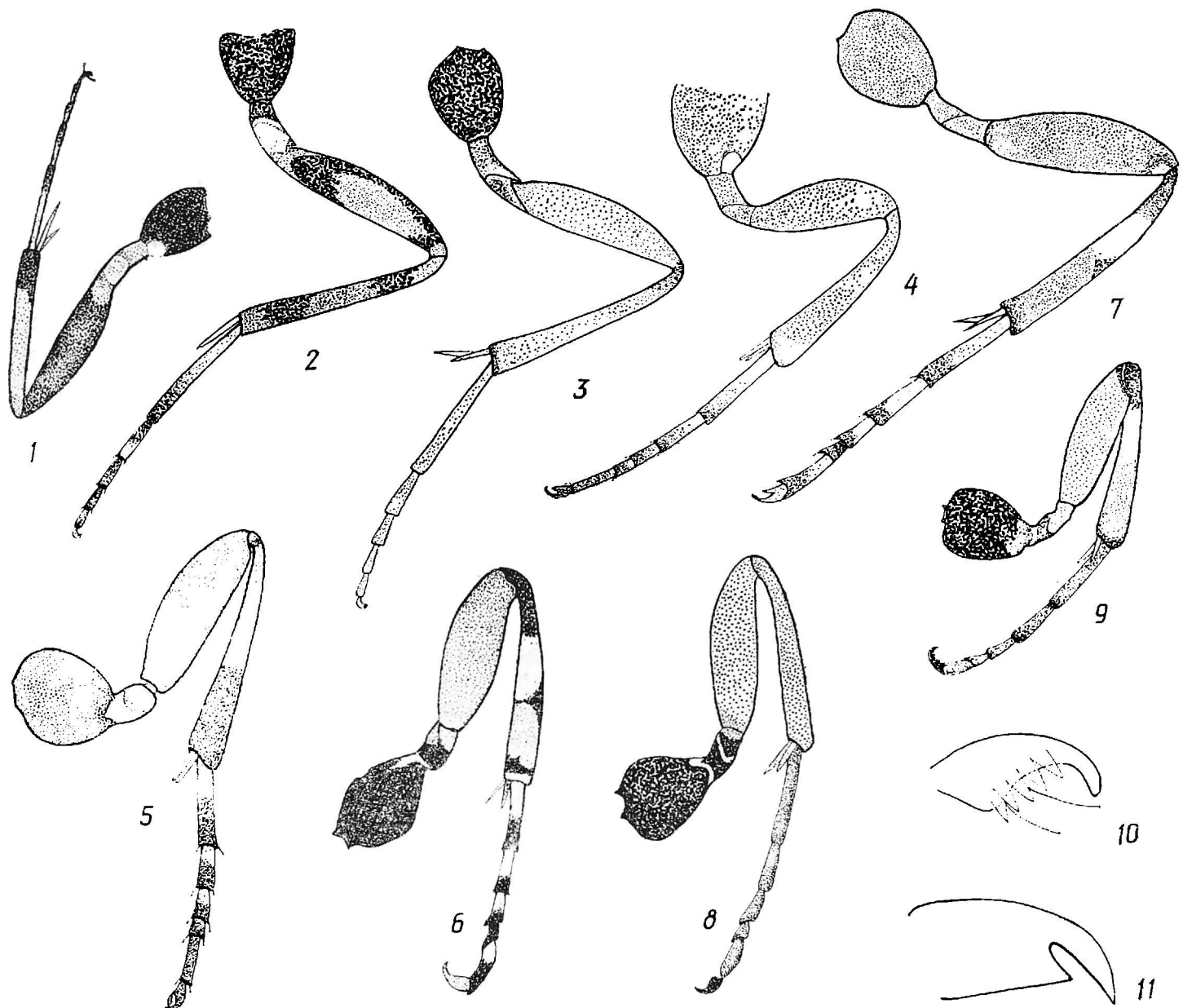
Рис. 3. Задние ноги и коготки лапок ихневмонид (по Каспаряну, и ориг.):

1 — Phobocampe tempestiva , 2 — Campoplex rufinator , 3 — C. restrictor , 4 — Apechthis compunctor , 5 — A. rufator , 6 — Itopectis maculator , 7 — I. alternans , 8 — Pimpla instigator , 9 — P. turionellae , 10 — Phytodietus polyzonias , 11 — Itopectis alternans .