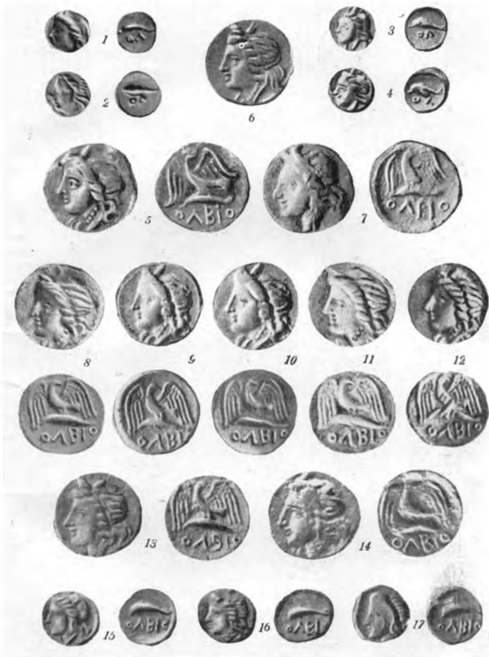
Табл. III. Золоті і срібні монети Ольвії (295—285 рр. до н. е.):

1—17 — підгрупа G. 1 — золото, 2,11 г. Лондон [63, табл. VI, 3]; 2 — золото, 2,13 г. Одеса, за оригіналом; 3 — золото, 2,11 г. Берлін [45, табл. II, 18]; 4 — золото, 2,13 г. Ермітаж [85, табл. IX, 18]; 5 — 12,28 г, Ермітаж, за оригіналом; 6 — 12,47 г, Париж [85, табл. IX, 2 (аверс)]; пор. 62, табл. XV, 2]; 7 — 12,41 г, Одеса, за оригіналом; 8 — 12,30 г, Париж [90, табл. IV, 18]; 9 — 12,46 г, Москва (ДИМ), за оригіналом; 10 — 12,35 г, Романов, за естампажем; 11 — 12,56 г, Лондон [65, стор. 265, фіг. 4]; 12 — вага та місце зберігання невідомі [12, т. бл. XXXII, 3]; 13 — 11,75 г, в продажу [37, табл. VII, 199]; 14 — 9,75 г, Лондон [89, табл. VII, 1]; 15 — 2,74 г, Москва (ДИМ), за оригіналом; 16 — 3,04 г, Лондон [89, табл. VII, 3]; 17 — 2,90 г, приватна збірка, за оригіналом.