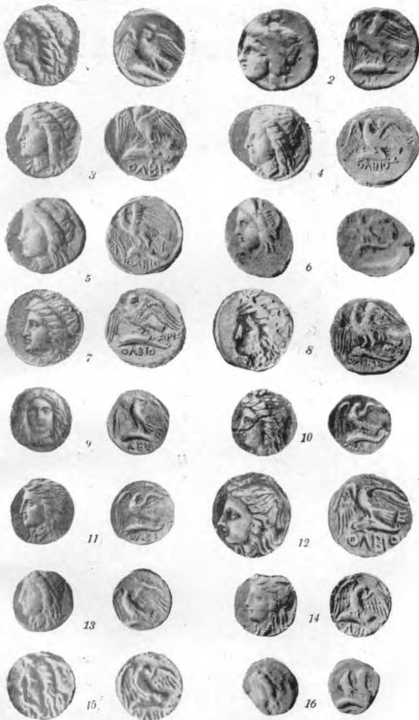
Табл. I. Срібні і золоті монети Ольвії (360—330 рр. до н. е.):

1 — підгрупа А; 2—6 — підгрупа В; 7, 8 — підгрупа С; 9—16 — підгрупа D. 1 — 41,73 г, Кембрідж [53, табл. 155, 4]; 2 — 12,37 г, Бертъ-Делатард [82, табл. 48, 1572]; 3 — 12,15 г, Джемсон [8, табл. XVIII, 2]; 4 — 12,78 г, Гіль [50, табл. 1, 2]; 5 — 12,06 г, Москва (ДИМ), за оригіналом; 6 — 8,21 г, Лондон [89, табл. VII, 2]; 7 — 12,53 г, Ермітаж, за оригіналом; 8 — 11,78 г, Сміт (72, табл. V, 398); 9 — 6,12 г, Лондон [63, табл. VI, 4]; 10 — 5,37 г, Ермітаж, за оригіналом; 11 — золото, 8,51 г, Брюссель [85, табл. IX, 1]; 12 — 11,92 г, приватна збірка, за оригіналом; 13 — 5,51 г, Москва (ДИМ), за оригіналом; 14 — 5,88 г, приватна збірка, за оригіналом; 15 — 5,62 г, Олеса, за естампажем ДАМ (монета втрачена); 16 — 2,97 г, Москва (ДИМ), за оригіналом.