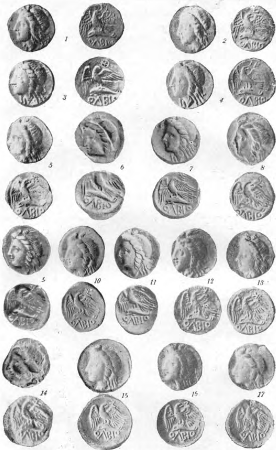
Табл. II. Срібні монети Ольвії (325—300 рр. до н. е.):

1 — 12,27 г, знайдено в Ольвії 1946 р., за оригіналом; 2 — 11,52 г, знайдено в Ольвії 1946 р., за оригіналом; 3 — 11,96 г, Куріс, за естампажем (монета втрачена); 4 — 12,12 г, приватна збірка, за оригіналом; 5 — 11,83 г, знайдено в Ольвії 1946 р., за оригіналом; 6 — 11,99 г, Одеса, за естампажем ДАМ (монета втрачена); 7 — 12,65 г, Берлін [73, табл. III, 1]; 8 — 12,21 г, Одеса, за естампажем ДАН (монета втрачена); 9 — 11,97 г, Ермітаж, за оригіналом; 10 — 11,85 г, приватна збірка, за оригіналом; 11 — 12,24 г, Одеса [75, табл. III, 2]; 12 — 12,03 г, Романов [81, табл. XX, 496]; 13 — 12,30 г, знайдено в Ольвії 1946 р., за оригіналом; 14 — 11,61 г, Одеса, за естампажем ДАМ [монета втрачена]; 15 — 11,57 г, приватна збірка, за оригіналом; 16 — 8,55 г, приватна збірка, за оригіналом; 17 — 8,51 г, Москва (ДМОМ), за оригіналом.