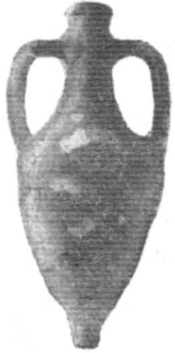
Рис. 2. Амфора з с. Бесідивка, \frac{1}{5} н. в.

Амфори з вузькою конічною нижньою половиною відомі в Херсонесі, звідки походить одна ціла амфора (зберігається в Херсонському музеї) і дві нижні частини амфор, відомі по публікаціях 8 . Такого типу амфори були знайдені в Інкерманському та Чорноречинському могильниках, розташованих поблизу Херсонеса. В Чорноречинському могильнику в 1950 р. було знайдено 2 амфори. Особливо багато подібних амфор походить з Інкермана — 12 екземплярів; із них 4 амфори, що складають ще довоєнні знахідки 1940—1941 рр., зберігаються нині у Київському державному історичному музеї (одна з них була опублікована) 9 , 8 амфор були виявлені розкопками 1948 р. 10 , 3 амфори цього типу походять з Керчі 11 . Крім того, відома одна безпаспортна амфора в Сімферопольському музеї і одна така ж в Керченському музеї (походить з околиць Керчі?).