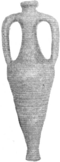
Рис. 1. Амфора з с. Гурбинці, \frac{1}{6} н. в.

Всі перелічені амфори вражають сталістю форм і розрізняються між собою лише незначними відміннями в кольорі й розмірі. Вони мають вузьке високе горло і витягнуту нижню частину, що конічно звужується донизу і закінчується ніжкою у вигляді порожньої трубочки. Горло має потовщений край. Ручки півкругло зігнуті, досить віддалені від корпусу, в розрізі овальні, мають зовні повздовжній рельєфний валик. Нижня половина амфор вкрита горизонтальними жолобками. Ніжка трохи розширюється донизу і має всередині округлий виступ (рис. 1). Висота амфор становить 43—51 см, найчастіше 50—51 см, діаметр бочка звичайно не перевищує \frac{1}{3} висоти посудини. Амфори мають здебільшого сіруватожовтий колір, іноді червоцуватий. Глина, з якої вони виготовлені, містить багато піску, нерідко крупнозернистого. Деякі амфори мають на горлі багаторядкові грецькі написи червоною фарбою (наприклад, амфора із Єрківців).