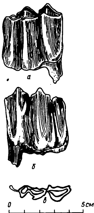
Рис. 2. Нижний коренной зуб M_3 (№ 37—4846) Plioportax gen. et sp. n.:

а — вид спереди; б — вид с наружной стороны; в, г, д — форма сечения рогового стержня, у основания, посередине, у вершины.