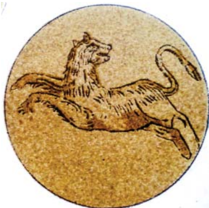
Рис. 2. Изображение льва в медальоне на фреске северо-западной башни Софийского собора Акварельная копия Ф. Г. Солнцева (середина XIX в.)