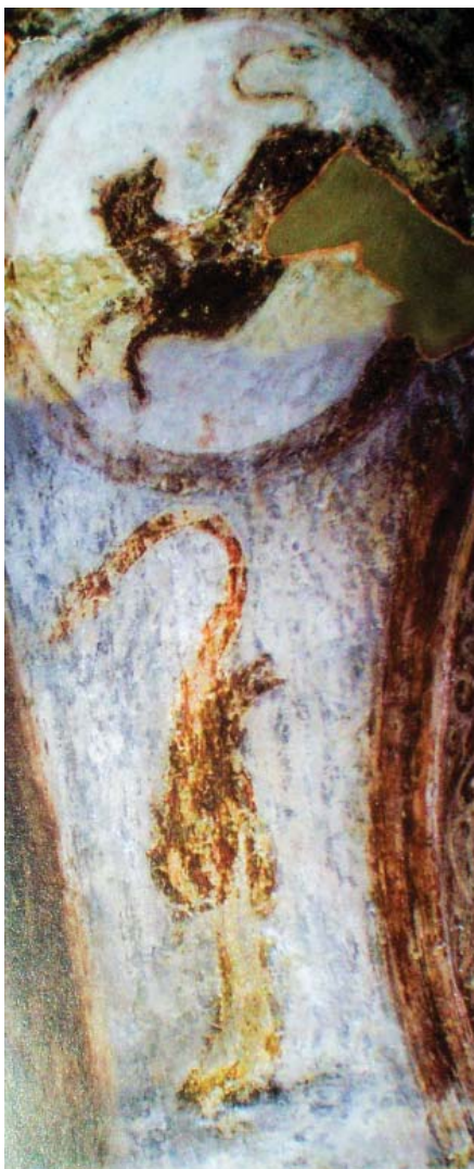
Рис. 1. Фрески «лев» и «лебедь» в северо-западной башне Софийского собора

дья» (см. рис. 1). По-видимому, исходно фон всей композиции был голубой, а вот зелёный цвет выглядит как позднее наслоение — его многочисленные мелкие фрагменты можно заметить непосредственно на коричневом теле зверя в медальоне (см. рис. 1).