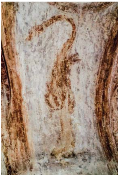
Рис. 4. Изображение «лебедя» на фреске северо-западной башни Софийского собора Современный вид

ных очертаний «крыло» и очень длинные, голенастые, вовсе невероятные для лебедя лапы. Очевидно, что средневековый художник изобразил здесь нечто другое. Всё это заставило нас изучить фреску более внимательно.