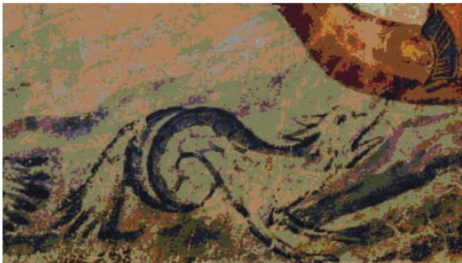
Рис. 6. Изображение похожего на «гиппокампа» водного существа на миниатюре Киевской псалтири