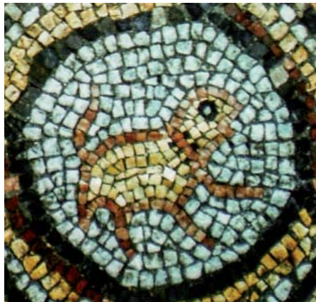
Рис. 3. Мозаичное изображение льва в медальоне в Загородном крестообразном храме Богородицы Влахернской в Херсонесе

Изображение льва в прыжке с загнутым на спину хвостом, помещённое в медальон, было довольно популярным в античное время. Однако для нас больший интерес представляют изображения, по времени создания близкие к софийскому. Пол Загородного храма Богородицы Влахернской в древнем Херсонесе покрыт многочисленными повторяющимися мозаичными изображениями животных: зверей, птиц и рыб, созданными приблизительно в конце XI в. Довольно часто там встречаются одинаковые, обращённые вправо либо влево, изображения «барса или льва с поднятым хвостом», помещённые в медальоны 11 . Рассмотрим одно из таких изображений (рис. 3). Отсутствие пятен и однородная жёлтая окраска зверя свидетельствуют, что в медальоне изображён не барс, а лев. На шее животного хорошо заметен исполненный более тёмными мозаичными элементами «ошейник» коричневого цвета, отороченный с двух сторон размещёнными в шахматном порядке чёрными мозаичными элементами, в совокупности обозначающими львиную гриву. Примечательно, что лев в медальоне изображён в сходной с софийской фреской позе — в движении и с загнутым на спину хвостом.