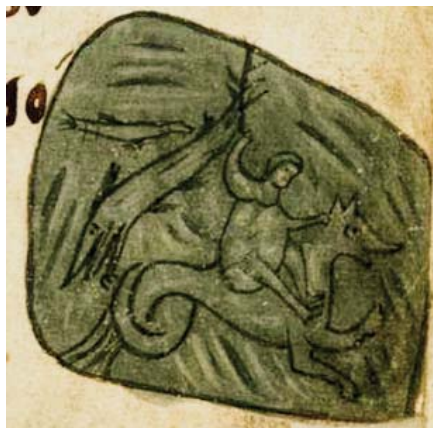
Рис. 9. Изображения фантастических морских существ на миниатюре Угличской псалтири , в некоторых деталях сходных с изображениями на фресках северо-западной башни Софийского собора