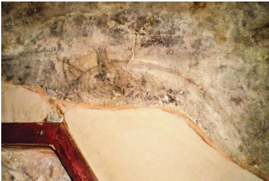
Рис. 7. Фрагмент изображения конской головы на фреске северо-западной башни Софийского собора Современный вид