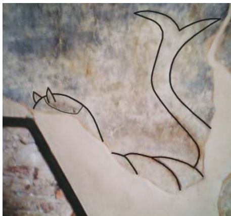
Рис. 8. Прорисовка изображения «гиппокампа» на фото фрески северо-западной башни Софийского собора (фото и прорисовка автора)