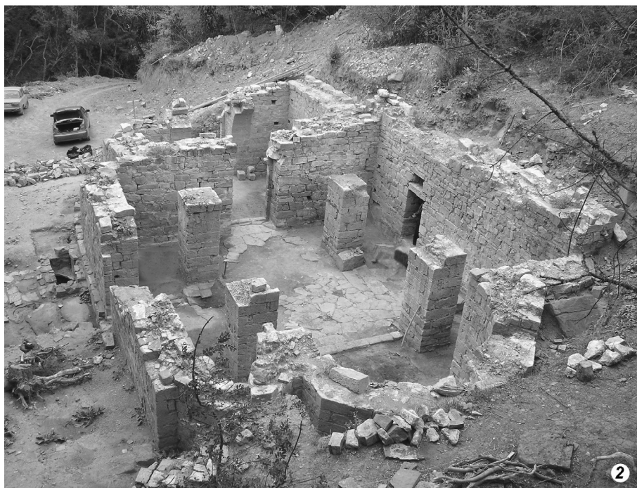
Рис. 1. Місцезнаходження та загальний вигляд храму у підніжжя гори Кіліса-Кая 1 — місцезнаходження храму у підніжжя гори Кіліса-Кая; 2 — загальний вигляд храму з боку вітварної частини