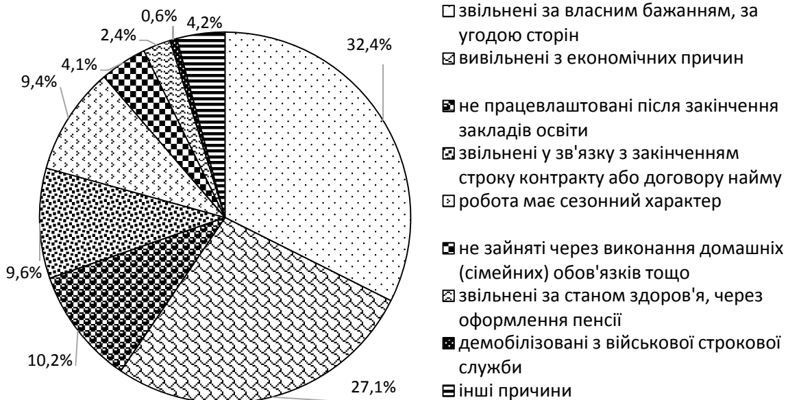
Рис. 2. Структура безробітного населення України за причинами незайнятості у 2021 р. (сформовано авторами на основі джерела [8])

При аналізі безробіття населення також важливо відзначити причини незайнятості. Наведемо структуру безробітного населення України за основними причинами безробіття у 2016 р. (за даними [8]) на рис. 2.