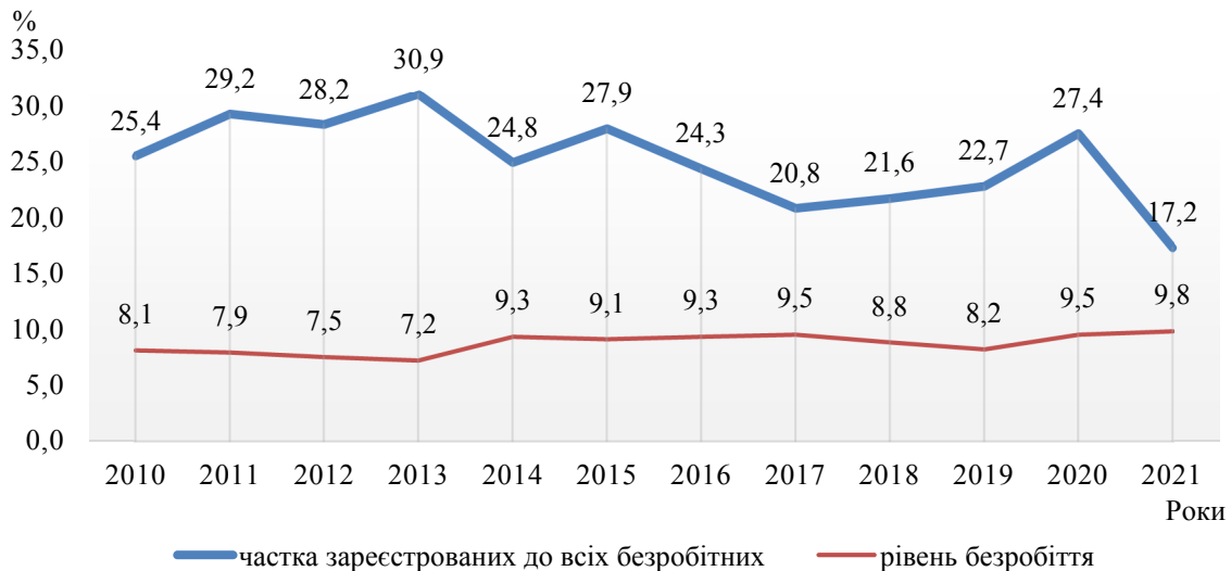
Рис. 1. Динаміка рівня безробіття та частки зареєстрованих до всіх безробітних (сформовано авторами на основі джерела [8])

сягнувши найнижчого рівня у 2021 р. – 17,2%. Це свідчить як про те, що значна частина населення має неофіційне працевлаштування, так і про те, що більшість непрацюючого населення не сподівається знайти роботу через центри зайнятості і навіть не звертається до них.