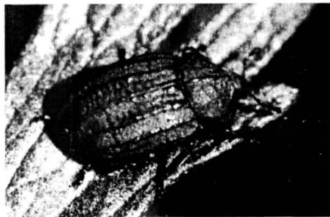
Рис. 1. Имаго Minyops carinatus .

Трофическая специализация. В результате проведенных исследований было установлено, что кормовым растением M. carinatus в природе является Ranunculus polyanthemus (L.). Лабораторные эксперименты показали возмож-