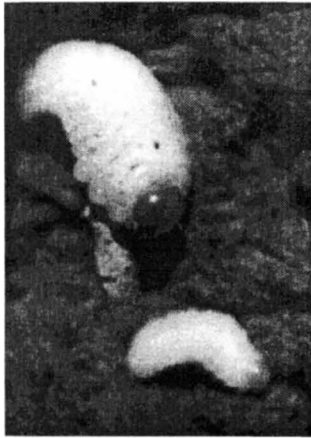
Рис. 4. Личинки Minyops carinatus .