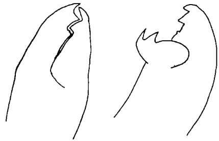
Рис. 3. Хелицера, № II.

Дифференциальный диагноз: описываемый новый вид от известного S. inexpectatus отличается, прежде всего, отсутствием на I и II коксах овальных полостей, более широким стернальным щитом. На спинном щите у него ячеистая скульптировка, а не орнамент из линий, идущих параллельно боковым краям щита у нимф и взрослых S. inexpectatus .