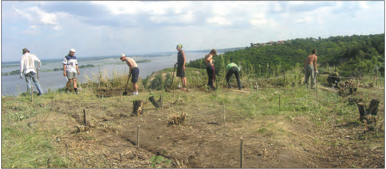
Рис. 4. Робочий момент початку стаціонарних досліджень пам'ятки