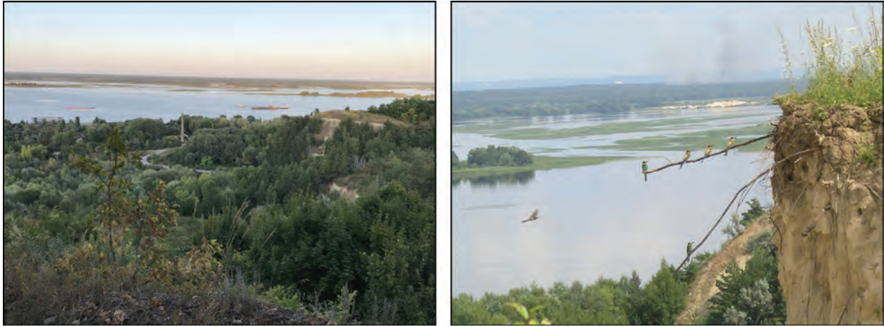
Рис. 6. Вигляд зі вцілілої ділянки пам'ятки на Канівське водосховище та панораму Лівобережжя

як демонструють наведені характеристики дослідженої ділянки кладовища, не дали підстав для формулювання висновків щодо певних закономірностей у розташуванні могил цього цвинтаря. Водночас, у центральній частині розкопу Б-3 простежена певна концентрація поховань, зокрема й з наведеними прикладами часткового перекривання за наявності на незначній відстані незайнятих територій. Не виключено, що описаний випадок вказує на існування у складі кладовища окремих ділянок, які належали одній родині або близьким родичам.