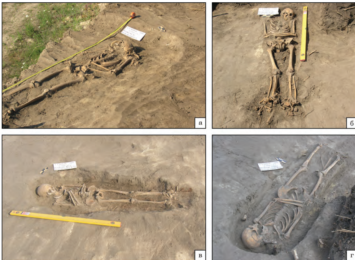
Рис. 5. Фото поховань із розкопаної ділянки могильника періоду козацтва у Стайках: а — № 1, вигляд з північного сходу; б — № 14, вигляд зі сходу; в — № 24, вигляд з південного сходу; г — № 16, вигляд із заходу

ноземі заповнення могильної ями не читалось. Безпосередньо під кістяком на глибині 1,00 м були виявлені згадані нумізматичні знахідки, що виступили хронологічним репером дослідженої у 2006 р. ділянки кладовища.