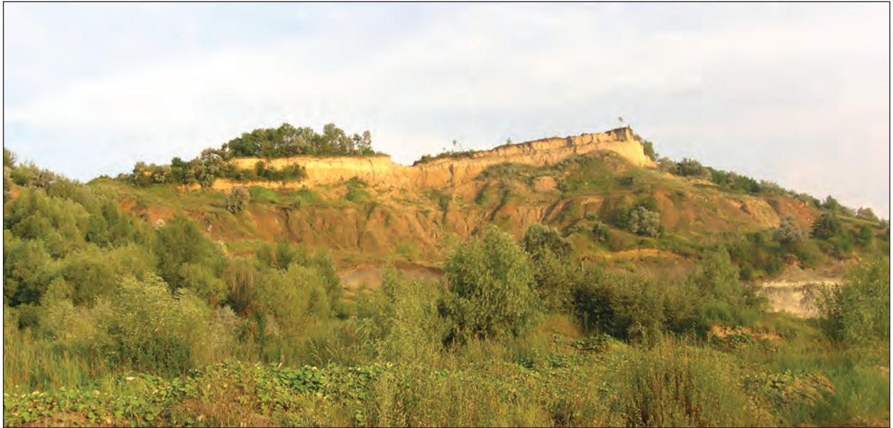
Рис. 2. Вціліла частина багатошарового поселення й могильника козацької доби Стайки 1, вигляд зі сходу