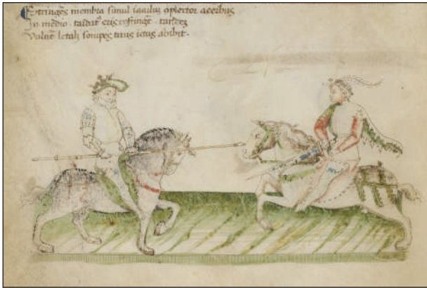
Рис. 1. Фіоре деї Лібері, «Florius de arte luctandi», fol 2 v, манускрипт, початок XV ст.

удару, причому з однаковим успіхом комбатант може міняти місцеположення рук на деревці. Найкраще лівосторонню стійку з винесеним вперед лівим плечем, ногою та рукою передає Пауль Гектор Майер у латиномовній версії свого трактату «De Arte Athletica», (створеному в середині XVI ст.), хоча за його ілюстрацією і рекомендаціями стоїть давня традиція, котра