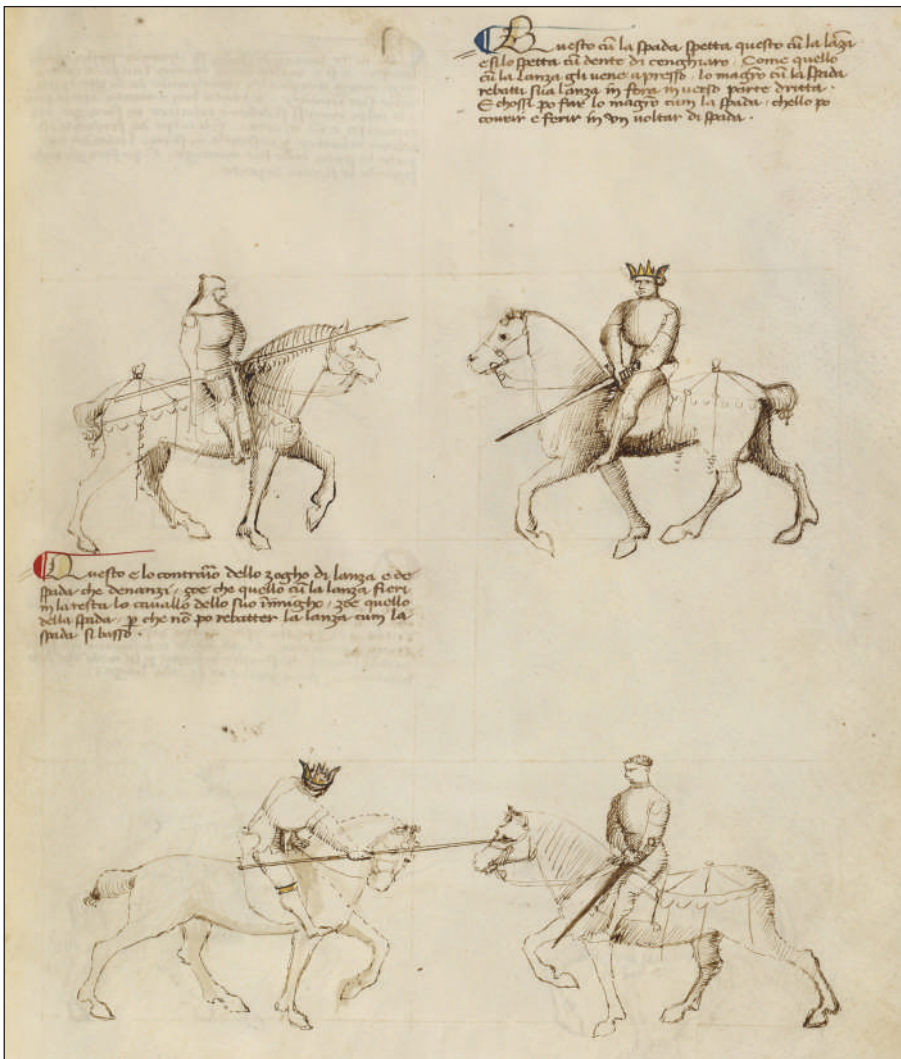
Рис. 2. Фіоре деї Лібері, «Fior di Battaglia», fol 43 r, манускрипт, початок XV ст.

Докладна аналогія «сарматської посадки» відтворена у рукописі початку XV ст. латинській версії трактату італійця Фіоре деї Лібері, котра відома під назвою «Florius de arte luctandi» — «Квіми бойового мистецтва» (рис. 1). Зображений зліва вершник, позначений короною майстра на голові, тримає спис горизонтально двома руками (права ззаду на деревці, ліва — спереду) з правого боку. Прийом підписаний так. «Обома руками я міцно тримаю спис посередині. Ти не встигнеш відбити мою атаку і твій кінь загине, отримавши смертельну рану» (Leoni, Mele 2018, р. 86—87). Очевидна різниця у алюрах коней натякає на те, що вершник із списом рухається повільно, натомість вершник з мечем атакує на швидкому алюрі, тому «летальний удар» в голову коня буде завдано не в таранній манері, але випадом. Власне, цей фрагмент трактату Фіоре дає чітке уявлення про варіативність застосування правостороннього дворучного хвату списа верхи. Подібний випад зображено на fol 43 r іншого рукопису цього трактату, що зберігаєть-