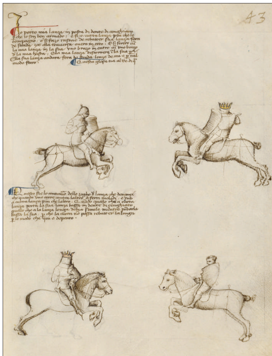
Рис. 6. Фіоре деі Лібері, «Fior di Battaglia», fol 41 r, манускрипт, початок XV ст.

користувався зображальними прийомами, відмінними від тих, що застосовані на батальній сцені. Правий вершник досягає противника мечем на близькій дистанції. На зображенні ясно помітно, що клинок після січного удару вгруз у шолом. Натомість лівий вершник вчиняє докладно те саме, що радять фехтувальні майстри XV—XVI ст. — атакувати не вершника, а коня. Якого вражає списом, утримуваним під пахвою.