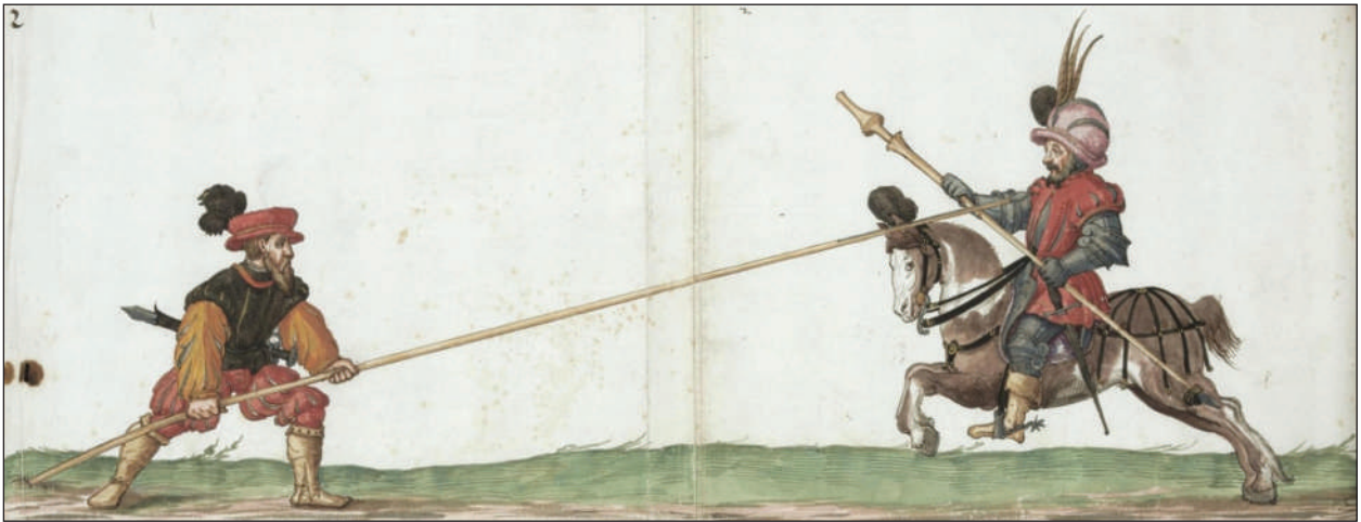
Рис. 3. Паулюс Гектор Маєр, «Opus Amplissimum de Arte Athletica», манускрипт fol 269 v, 1542 р.

Зустрічається в європейській традиції кінного бою в обладунку і опис та зображення діагонального та дворучного хвату списа, про який пише Юнкельман. Його теж описує Маєр, проте прийом є запозичений із фехтбуху Паулюса Кайля, котрий жив в середині — другій половині XV ст. Маєр пише про прийом так (рис. 4): «Коли ваш противник вклав свій спис до аррету, тоді зачепіть свій повід на нижній гак свого обладунку і візьміть спис обома руками