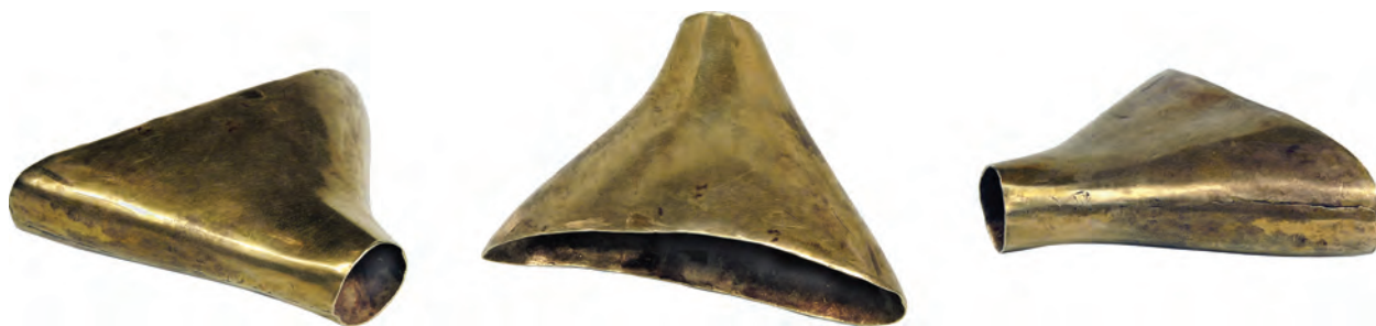
Рис. 2. Золотий предмет (вотолка) кінського спорядження з колекції В. Н. і Б. І. Ханенків

1906, с. 158, рис. 17) двох різних розмірів — 63 і 58 мм. Зважаючи на всі обставини, можна стверджувати, що бляхи з ханенківської колекції також походять з кургану Огуз.