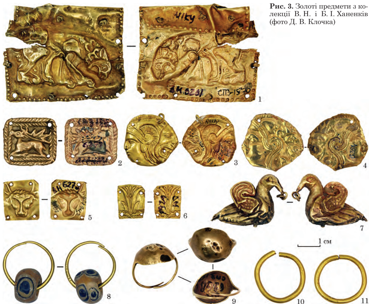
Рис. 3. Золоті предмети з колекції В. Н. і Б. І. Ханенків

До спорядження коней відносяться й предмети, що склали комплекс нагрудних прикрас. Вони виготовлені із золота, срібла і бронзи та, вірогідно, належали до кількох комплектів — можливо, 1 або 2 золотих та 1 срібного (Спицын 1906, с. 159, рис. 19, 21, 23; Манцевич 1980, с. 282, рис. 10; 11). Оскільки відсутні будь-які дані про поховальний кортеж, то можна припустити, що золоті конуси також були належністю верхових коней і могли бути задіяні як попарно, так і по одному, що більш імовірно. В такому разі практично всі коні, поховані у дромосі Центральної споруди кургану Огуз, мали ті чи інші нагрудні прикраси: нагрудник з підвісками або вотолку.