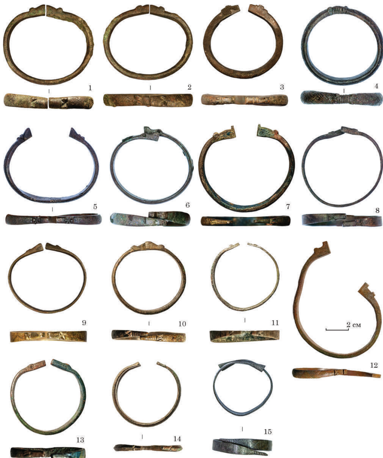
Рис. 1. Колекція браслетів з зооморфними закінченнями могильника Острів: 1—2, 9 — жіноче поховання 2; 3 — чоловіче поховання 23; 4, 6 — жіноче поховання 72; 5, 8, 12 — випадкові знахідки; 7 — жіноче поховання 1; 10 — чоловіче поховання 41; 11, 14 — жіноче поховання 46; 13 — жіноче поховання 53; 15 — культурний шар

менше — серед прусів, скальвів і земгалів) та навіть у скандинавів, передусім — на о-ві Готланд (Thunmark-Nylén 1998, Taf. 160: 1—5).