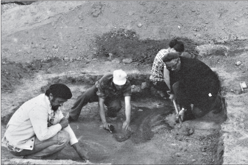
Розчистка землянки козацького дозору на кургані поблизу с. Чкалове, Запоріжжя, 1978 р.

Дніпро) і на Ігреньському півострові, де у 1660 р. славний козацький отаман Іван Сірко розгромив великий загін татар, звільнивши багато бранців. Кінематографісти разом з Д. Я. Телегіним також відвідали острів Хортицю (Там само, арк. 17—18а).