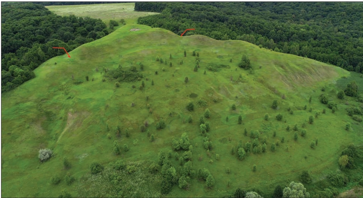
Рис. 2. Фотозйомка городища Ширяєве за допомогою БПЛА, вид з боку заплави

дучи фахівцем зі слов'яно-руської археології, дослідник не приділив належної уваги вивченню пам'ятки скіфського часу. Зокрема, це стосується тексту наукового звіту де інформація про розкопки Ширяєвського городища вкрай обмежена й міститься переважно на сторінках польового щоденника. Так, в 1948 р. Д.Т. Березовець проводив археологічні розкопки на городищі «Курган» поблизу с. Волинцеве. В один з днів основна частина місцевих робітників з приводу релігійного свята не вийшла на роботу. Тоді Дмитро Тарасович разом з кількома школярами вирішив відвідати городище Ширяєве, що знаходилося неподалік, та закласти на ньому кілька розвідувальних шурфів. Останні мали розмір 2 \times 4 , 2 \times 4 та 3 \times 5 м і розміщувалися в центрі та по краю майданчика в північно-західній та західній частинах. Сліди цих розкопок і зараз помітні, принаймні по краях городища. За свідченням Д. Т. Березовця однорідний культурний шар мав потужність 0,8—0,85 м. Не можна з впевненістю твердити, але, вірогідніше за все, дослідник лише вказав глибину шурфів, на яку вдалося вийти протягом одного робочого дня зусиллями кількох школярів. Як показали подальші дослідження потужність культурного шару сягає більше одного метру в центрі та майже два метри (як мінімум 1,7 м) по краях майданчика.