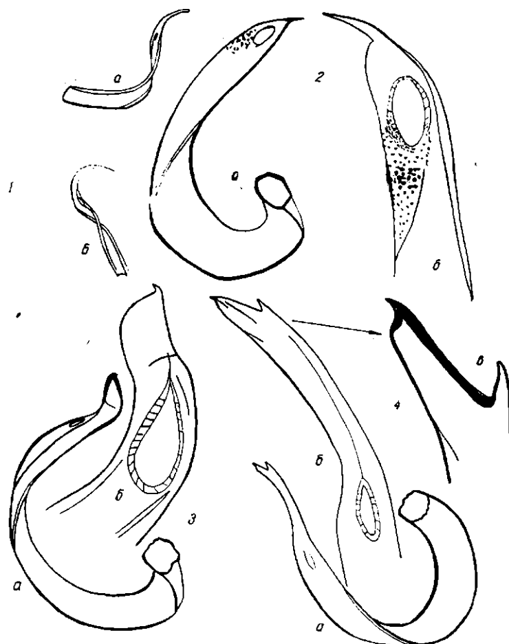
Рис. 1. Эдеагусы слепняков:

1 — Asciodema obsoletum (Fieb.), вид в двух разных положениях (Болгария); 2 — Psallodema fieberi (Dgl, Sc.); а — общий вид; б — вершина; 3 — P. intergerinum Putsh.; а — общий вид; б — вершина; 4 — P. ulmicola Putsh.; а — общий вид; б — вершина; в — апикальная часть вершины.