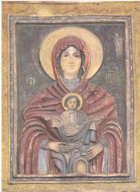
Іл. 1. Керамічна ікона «Єлецька Богородиця». Поч. XVIII ст.

У 1981 р. реставраторами-художниками Р. Боголюб та А. Лисаневичем із західного фасаду Успенського собору Єлецького монастиря була знята керамічна ікона із зображенням Богородиці та Ісуса Христа (Іл. 1). У цей час відбувалася реставрація цього собору. Ікона зазнала ушкоджень під час Другої світової війни і її необхідно було реставрувати.