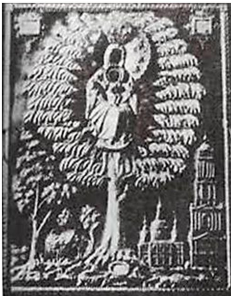
Іл. 6. Ікона «Слецька Богородиця» з Успенського собору м. Харкова. Др. пол. XVII ст.

собору м. Харкова. Водночас зображення на цих іконах подібне до гравюри Богородиці на дереві з книги Іоанікія Галятовського «Скарбница потребная», яка була видана у 1676 р. (Іл. 7). На ній зображена Марія в мандорлі у променях сяйва на дереві, внизу ліворуч – Успенський собор Єлецького монастиря, праворуч – частина стіни та вежа Чернігівської фортеці. Богородиця, що сидить, тримає на колінах Ісуса, правою рукою торкається його правої ніжки. Христос зображений фронтально з розведеними в сторони руками: правою рукою благословляє, в лівій тримає сувій. Навколо голів Богородиці й Спасителя – німби. Гравюра має підпис: «Образъ Пресвятія Богородице Черниговской». Зображення на гравюрі відповідає опису ікони Богородиці на ялині з книги І. Галятовського «Скарбница потребная»: «...где намалювано дерево еловое альбо елину зъ галузьями зелеными, межи тыми галузьями зелеными высоко сидячая ест намалювана родителка Божая, на своихъ коленах дитячко, Христа сидячого, под пахи левою рукою держачая, а правою рукою Христа за ноги держить, а Христос въ левой руке держить хартію звитую» 8 . Можна припустити, що так могла виглядати ікона «Богородиця Єлецька», яка з'явилася у 1676 р. в монастирі.