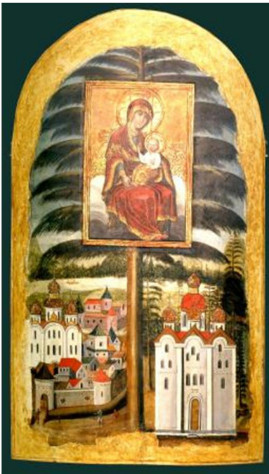
Лл. 3. Ікона «Єлецька Богородиця». 90-ті рр. XVII ст.

Керамічна ікона свого часу прикрашала західний фасад Успенського собору й була в лонеті центральної закомари в обрамленні барокового картуша. На іконі «Єлецька Богородиця» вона не зафіксована. Датування іконі «Єлецька Богородиця» 90-ми рр. XVII ст. А. Адрюг аргументував тим, що на ній ще відсутній приділ Св. Якова, в якому було поховано чернігівського полковника Якова Лизогуба (помер у 1698 р.) 1 . Приділ Св. Якова було прибудовано з південної сторони собору і освячено у 1701 р. 2 Можна припустити, що ікона з'явилася на фасаді собору пізніше, на початку XVIII ст. Подібні дві ікони оздоблюють також дзвіницю будинку Чернігівського колегіуму, яка була побудована, як свідчить її закладна дошка з гербом гетьмана І. Мазепи, у 1700–1702 рр. Одна ікона розміщена всередині верхнього ярусу дзвіниці, інша – ззовні, на південно-східній стороні, між розетками, які утворюють орнаментальний фриз під карнизом даху. На недалекій відстані від неї є також керамічна ікона «Спас Нерукотворний». Ще одна керамічна ікона із зображенням Богородиці прикрашала центральну браму новгород-сіверського Спасо-Преображенського монастиря. І. Ігнатенко вважає, що керамічні ікони були виготовлені з однієї форми, тобто