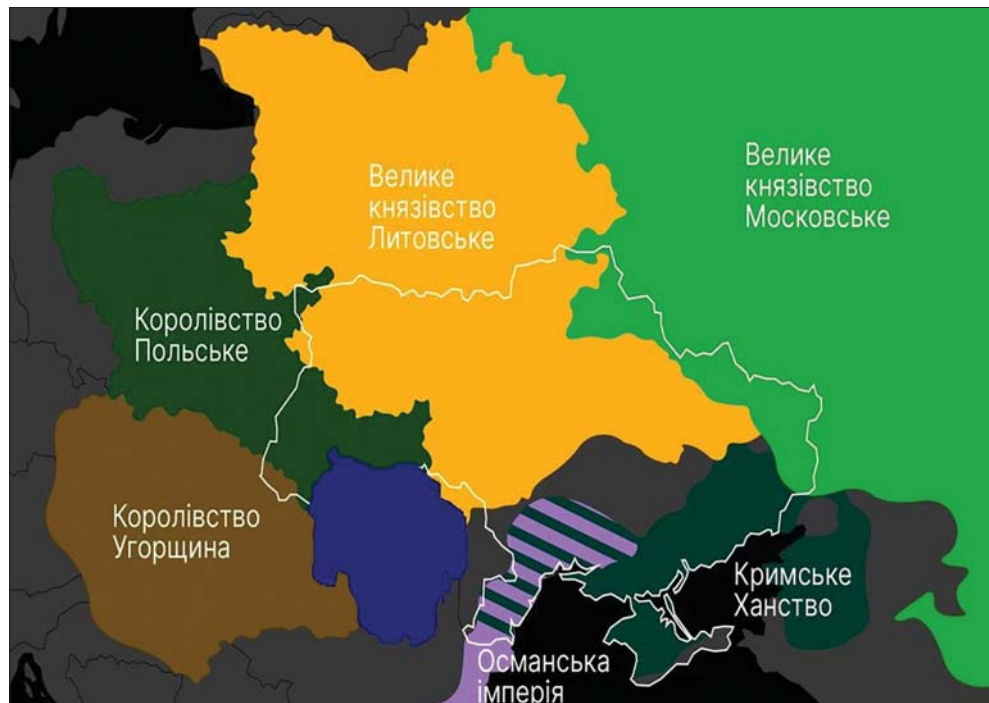
Велике князівство Литовське (XIV — перша половина XVI ст.)

Виникнення та еволюція козацтва, заснування Запорозької Січі пов'язані з наступним етапом розвитку державницької традиції. У середині XVII ст. на цивілізаційному та культурному перехресті Сходу Європи постала Українська козацька держава (офіційна назва — Військо Запорозьке). Ця ранньомодерна станова держава органічно поєднувала як окцидентальні, так і виразні орієнтальні риси. Вона сформувалася на соціокультурній основі козацтва як степового лицарства, яке в