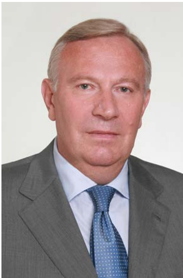
СМОЛІЙ Валерій Андрійович — академік НАН України, академік-секретар Відділення історії, філософії та права НАН України, директор Інституту історії України НАН України