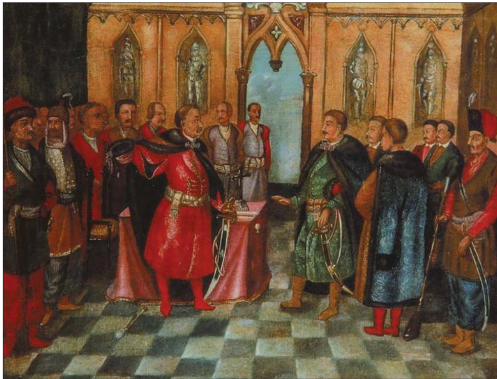
Переговори Богдана Хмельницького з польським послом Якубом Смяровським під Замостям 1648 р. Робота XVIII ст.

багатьох аспектах нагадувало західні ордени і водночас запозичило чимало прикмет і вад кошового світу.