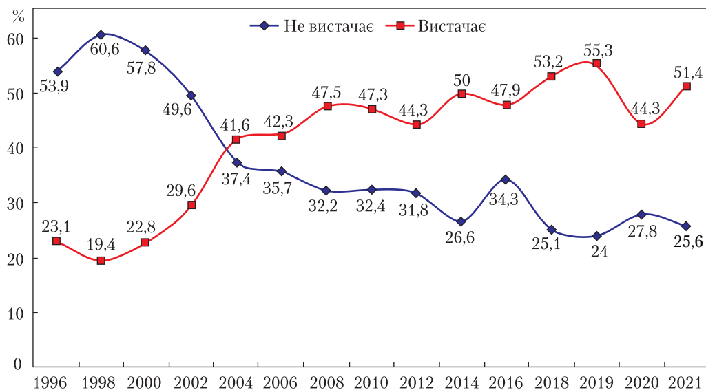
Рис. 1. Доступність соціальних благ сьогодення. Динаміка показників достатності та недостатності необхідних продуктів харчування для дорослого населення України

• національна стійкість, яка приховувалася і часто-густо зберігалася у родинному колі чи персональних життєвих історіях в умовах страшних соціокультурних катастроф 1920-х — 1930-х років, інспірованих сталінським режимом, що спричинили масове знищення українського населення;