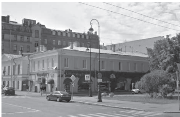
Будинок, де містилася кондитерська Деллі (Великий проспект, 20 / 7-ма лінія, 22).

Проговоривши всю ніч після знайомства, Штернберг і герой Шевченкової повісті на світанку йдуть пити чай у «Золотой якорь» [31:4, 152] — трактир у зведеному наприкінці XVIII ст. будинку за сучасною адресою Бузький провулок, 6 / 6-та лінія, 7. Леонід Ушкалов додає, що ресторан тут відкрився ще 1823 р. [27, 296]. У 1835 р. споруду суттєво перебудовано. У 1830—1860-х роках триповерхова будівля належала дружині надвірного радника Тихой, в якої купчиха 2-ї гільдії А. Лукінська орендувала приміщення для трактиру. Його традиційно відвідували іноземні моряки суден, які швартувалися на пристанях Миколаївської набережної. В історію він увійшов головно як місце зустрічей художників [21, 301]. Трактир Лукінської в будинку Тихой на 6-й лінії фіксує у 1849 р. і довідник М. Цилова [28, 473].