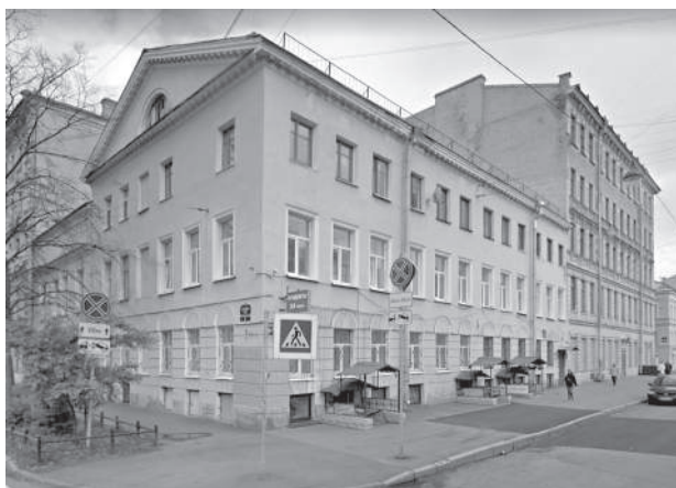
Будинок, де був трактир «Золотой якорь» (Бузький провулок, 6 / 6-та лінія, 7).