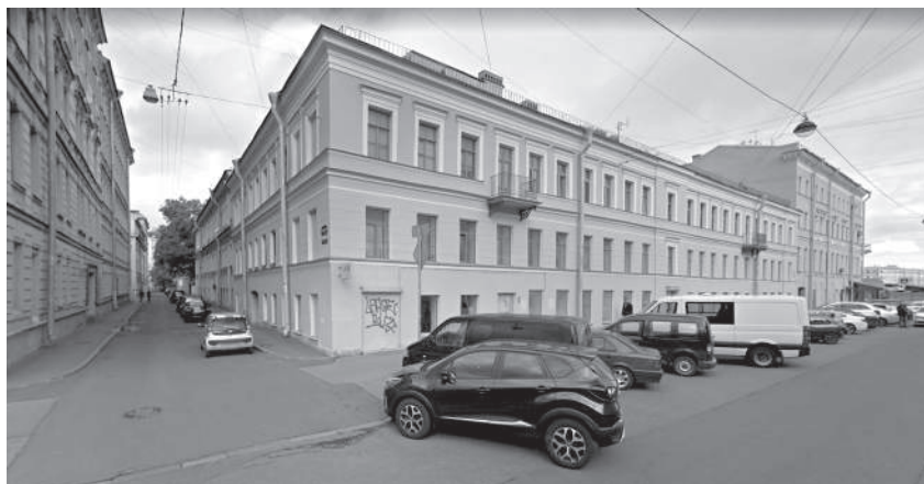
Будинок, у якому, ймовірно, містився трактир «Берлін» (6-та лінія, 3 / Академічний провулок, 10). www.google.com/maps

і продовжив своєїрідну традицію, відкривши у новобудові «штофную лавку», а згодом винний магазин [21, 299—300]. Цей магазин у будинку «Мелюковых» фіксує і довідник М. Цилова [28, 76]. У 1870-х роках надбудовано третій поверх. Особливості архітектури, зокрема напівпідвальний перший поверх із кількома входами, схиляють до думки, що саме в цьому будинку і розміщувався трактир.