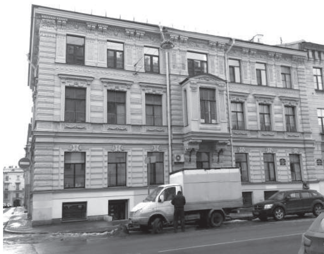
Будинок Г. Аренс, у якому Шевченко мешкав у 1839 р. (7-ма лінія, 4 / Академічний провулок, 7).

Трактир, згаданий у повісті за описовою адресою, Шевченко, очевидно, добре знав, бо не пізніше червня 1839 р. оселився в будинку Генрієтти Аренс на протилежній 7-й лінії (за сучасною нумерацією, № 4 / Академічний провулок, 7), тобто через дорогу від гаданого розташування трактиру. Тут поет мешкав до другої половини листопада 1839 р. [15, 80; 85], коли через хворобу був змушений перебраться до майстерні Ф. Пономарьова в Академії мистецтв, який у спогадах прямо вказав, що тоді Шевченко жив в будинку «Аренста» (Аренс) [26, 589]. Двоповерховий будинок Аренс архітектор Іоганн Цим 1840-го добудував третім поверхом [1, 319].